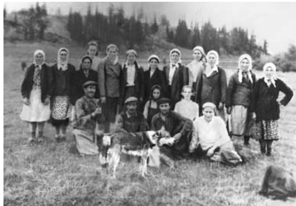
В деревне Дойкар на покосе

Из тракторов в колхозе были: один гусеничный СТЗ-НАТИ, 3 ДТ-54; колесный СХТЗ, 2 трактора «Беларусь»; 3 комбайна самоходных С-4 13-футовые. Транспортные средства: 4 ГАЗ-51 на 2,5 т, 5 ЗИС-5 на 3,0 т, ЗИС-150 на 4,0 т; легковой автомобиль и мотоцикл. Сельскохозяйственные машины: почвообрабатывающие – плуги 5-корпусные, 4-корпусные, 3-корпусные, лушпильники дисковые и лемешные, бороны дисковые и зубовые, культиваторы КПН-4, КРН-2,5. Посевные маши-