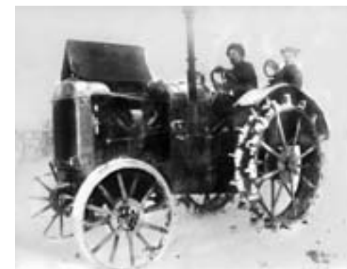
Второй год работы МТС. 1949 г.

Колхозники трудились не покладая рук, понимая, что надо кормить фронт, снабжать продуктами питания заводы и фабрики. Колхоз «Совет» считался одним из лучших