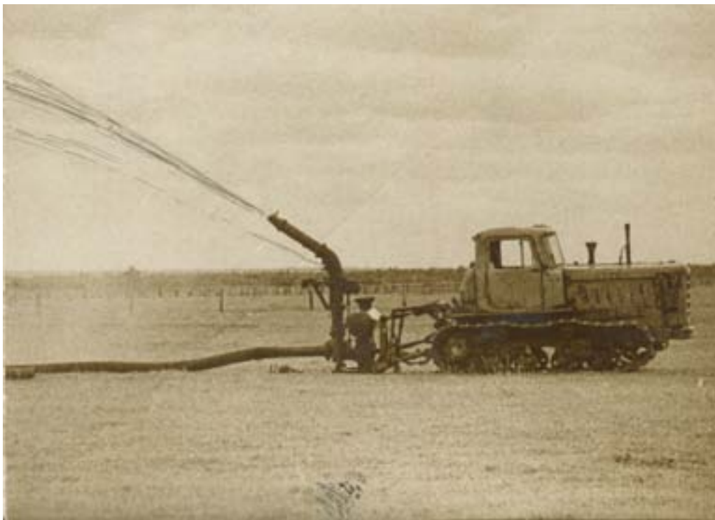
Работает поливальная установка