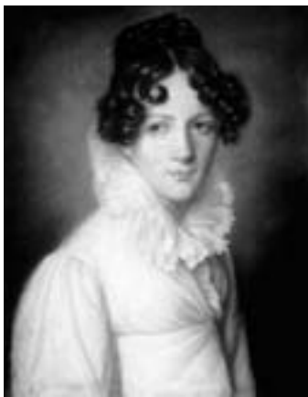
Графиня Наталья Павловна Строганова

Село Архангельское к востоку граничит селом Купросским графа Григория Александровича Строганова и с сей стороны занимает пространства в своем приходе на 12 верст; к западу занимает 8 верст и граничит селом Кудымкарским графини Натальи Павловны Строгановой; к югу отстоит на 8 же верстах и гра-