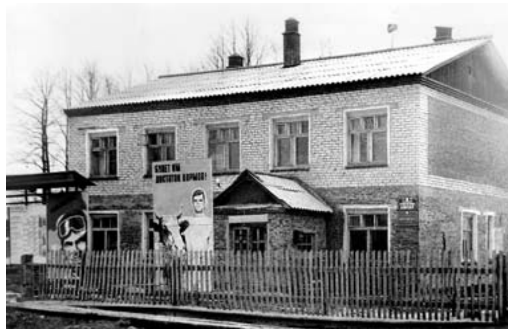
Правление колхоза «Совет». 1980-е гг.