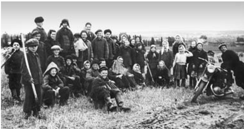
На полях Сековской бригады. После уборки картофеля. 1958 г.

ны – сеялки зерновые узкорядные и зернотравяные; уборочные – сенокосилки, прессы сенные, жатки рядовые, подборщики к комбайнам, приспособления для уборки полевого хлеба, молотилки зерновые, зерноочистительные машины ОС-3, зерносушилки, веялки-сортировки на 8–10 т, льномолотилки; машины для приготовления кормов – силосорезки и соломорезки. Имелось очень много конного и прочего инвентаря, так как очень много работ выполнялось с использованием конной тяги (плуги, культиваторы, окучники, сеялки зерновые и овощные, сенокосилки, грабли, жатки-самосброски, повозки на железном ходу, соломорезки, корнеклубнемои, кормозапарники, центрифуги, молокомеры, сепараторы).