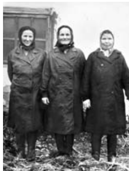
Животноводы Архангельской фермы. 1983 г.

Распилили 151 м 3 пиломатериала. Изготовили 44 тыс. шт. кирпича.