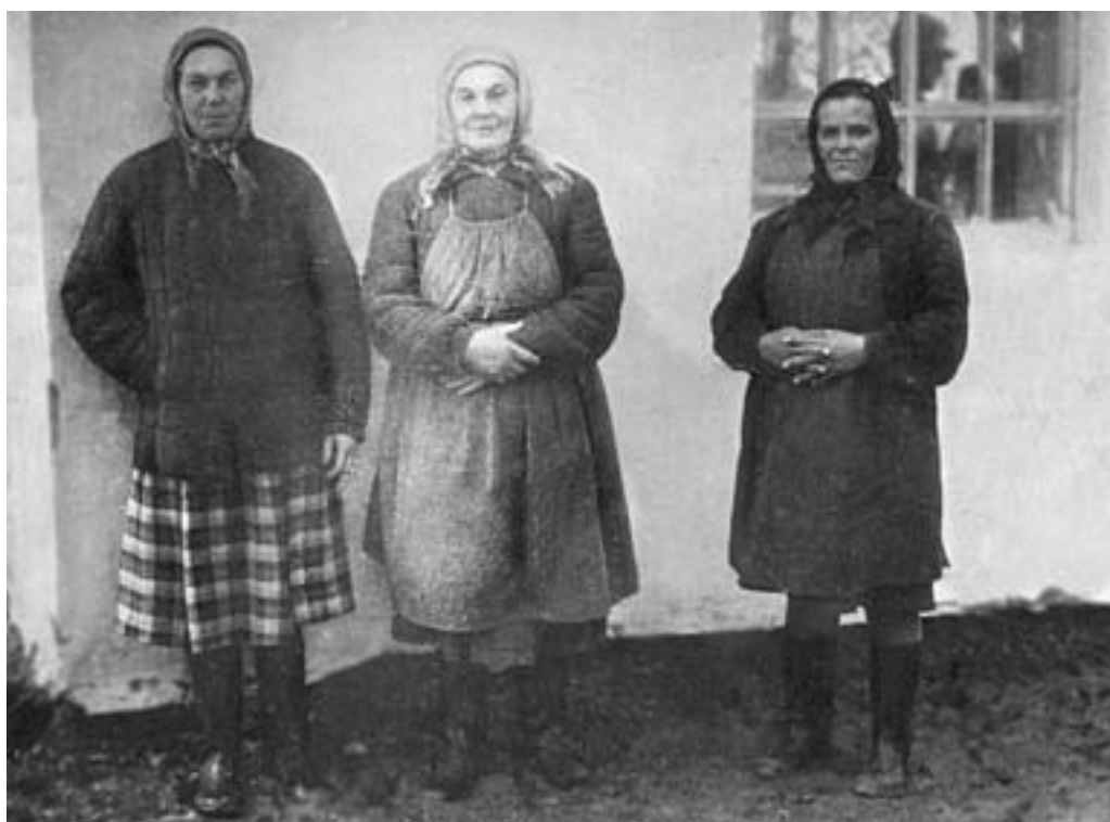
Работницы Архангельского птичника