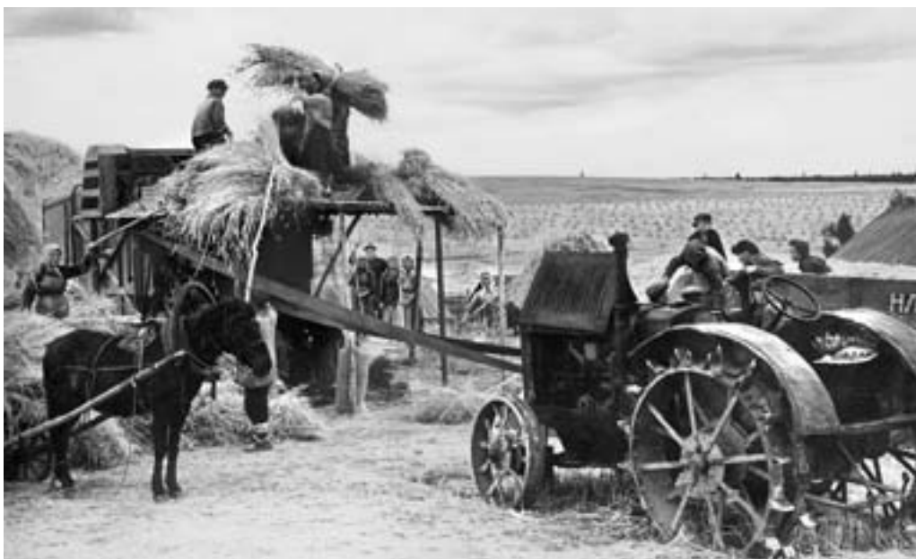
Обмолот хлеба на сложной молотилке в колхозе «Совет». 1938 г.

За два года я вырастила 40 телят, целую ферму! Не один раз была премирована.