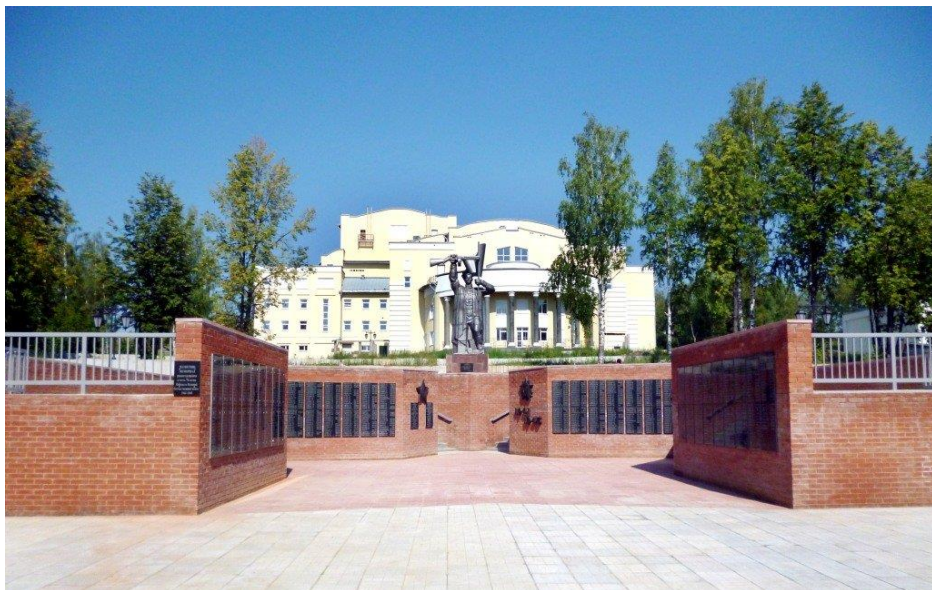
Мемориал Победы в г. Кудымкар.