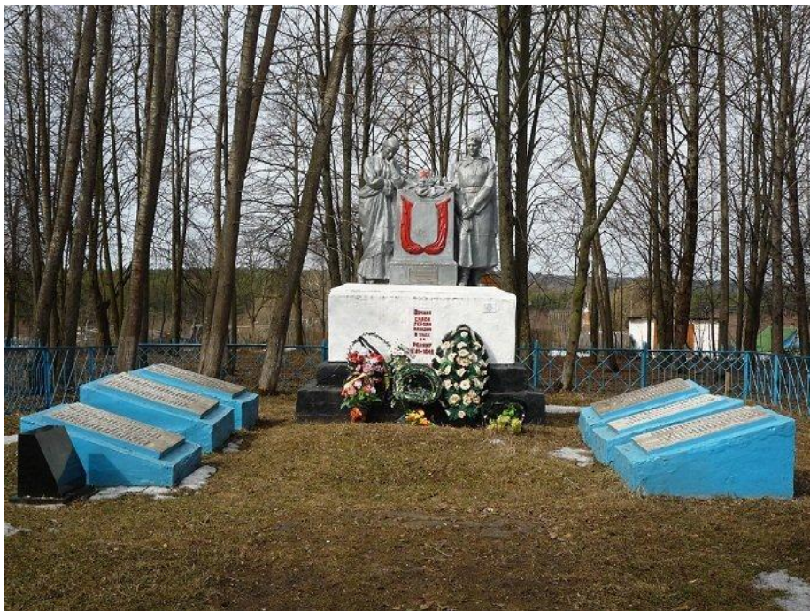
Воинское захоронение в д. Ивановское Износковского района Калужской области.

Ильинки. Перезахоронен в д. Ивановское Износковского района Калужской обл.