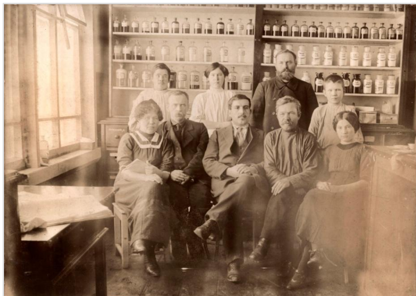
Аптека Юсьвинской земской больницы, 1914 г.