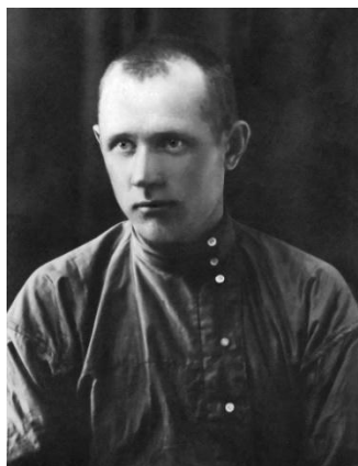
Фото 1936 г.