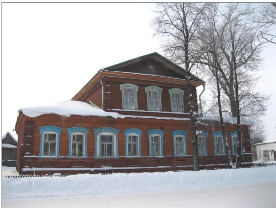
с.Юсьва, ул. Красноармейская 18, дом Боталова Ф.А. Является памятником регионального значения