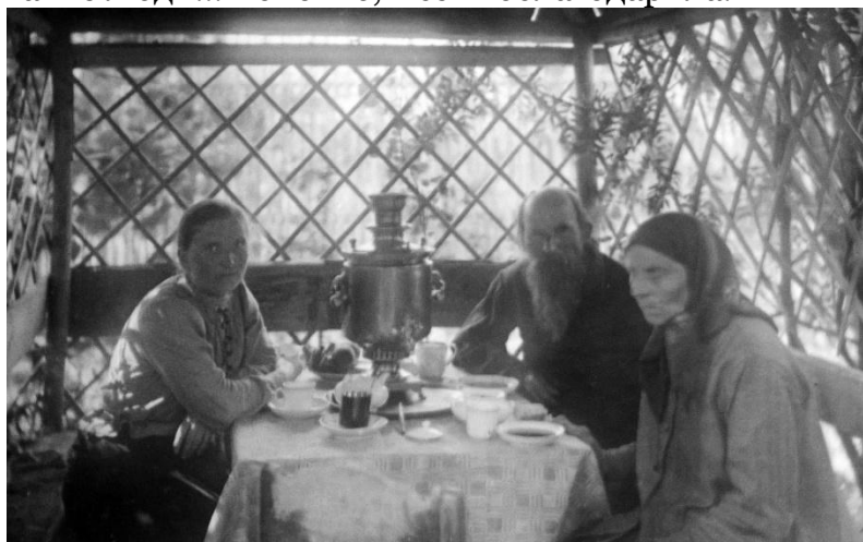
с.Юсьва, 1902 г., фото Юрье Вихманна Источник хранения: Национальный архив Финляндии

В поисках фото мне помогали незнакомые люди, да ещё такие люди... Конечно, всех поблагодарила.